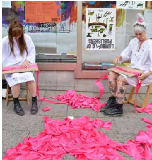
Aufstand der Schwestern (documenta fifteen 2022) Performance, home is where... women are killed.